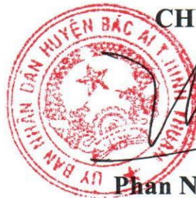
Phan Ninh Thuận